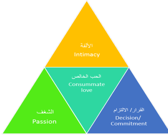
شكل (1) : مكونات الحب الرئيسية المصدر: (Sternberg, 1997)