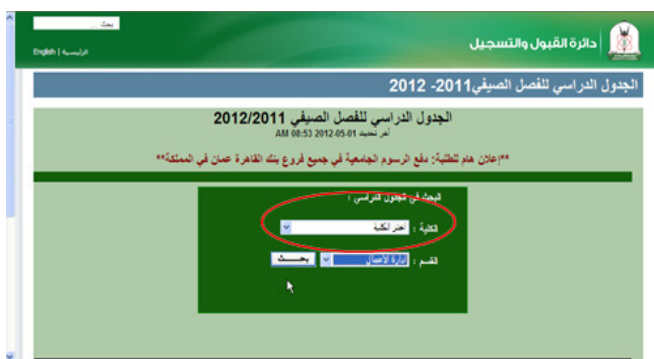
الشكل رقم (3): صفحة الجدول الدراسي

2. عدم ملاءمة المحتوى: تتعلق هذه المشكلة بوجود بعض الصفحات على الموقع التي تعرض محتوى غير واضح بالنسبة إلى الطلاب. فصفحة الجدول الدراسي مثلاً مصممة لعرض الجدول الدراسي لقسم معين، ويوجد على هذه الصفحة مربعين مركبين (Combo Box)؛ الأول يتعلق بكليات الجامعة، والثاني يتعلق بأقسام الكلية التابعة. القيمة الافتراضية للمربعين المركبين: «اختر الكلية» و«اختر القسم» على التوالي. على الطالب أن يختار إحدى الكليات من قائمة المربع المركب الخاص بالكليات، ومن ثم أحد الأقسام من قائمة المربع المركب الخاص بالأقسام التابعة للكلية، ومن ثم انقر على زر «بحث» للحصول على الجدول الدراسي الخاص بالقسم (الشكل رقم (3)). تتعلق المشكلة في هذه الصفحة بحقيقة أنه عندما يختار الطالب الكلية من قائمة المربع المركب الخاص بالكليات، فإن القيمة المتوقعة للمربع المركب الخاص بالكليات والتي تمثل اسم الكلية لا تتغير. تظهر القيمة الافتراضية للمربع المركب الخاص بالكليات بدلاً منها «اختر الكلية». هذه المشكلة سببت إرباكاً للطلاب، حيث كرروا محاولتهم لاختيار الكلية أكثر من مرة من القائمة المخصصة لها، ثم خرجوا من الصفحة معتقدين بأن الصفحة لا تعمل. من الجدير بالذكر أن الخبراء المقومين لم يتوصلوا إلى هذه المشكلة خلال تفويهم للموقع.