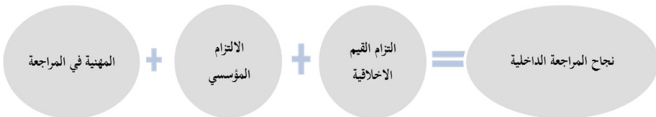
شكل (5) : ضمانات نجاح المراجعة الداخلية