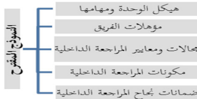
شكل (2): أبعاد الأنموذج المقترح