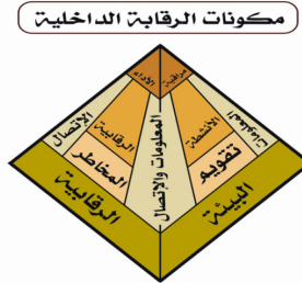
شكل (3): مكونات الرقابة الداخلية

يتضمن نظام المراجعة الداخلية الأساليب التي تتبناها الإدارة للتأكد من الوفاء بأهدافها واستخدام مواردها؛ بما يتفق مع القوانين والنظم والسياسات وتقييم المخاطر وحماية الموارد، ويوضح الشكل (3) هذه المكونات :